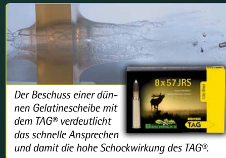
Der Beschuss einer dünnen Gelatinescheibe mit dem TAG® verdeutlicht das schnelle Ansprechen und damit die hohe Schockwirkung des TAG®.

Bei größeren Entfernungen empfiehlt sich die Verwendung eines Magnumkalibers. Von beiden Geschosstypen gibt es inzwischen mehrere hundert Abschüsse, die im Rahmen einer Studie von der FH Eberswalde und im Hause BRENNEKE analysiert worden sind. Abgerundet wird das bleifrei Sortiment von BRENNEKE durch das seit Jahren bewährte Torpedo-Alternativ-Geschoss (TAG®). Auch das TAG