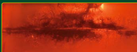
Der Gelatineblock verdeutlicht den sofortigen Beginn der Energieabgabe des nature-Geschosses bei gleichzeitig guter Tiefenwirkung inklusive Ausschuss.

Fünf Schuss-Gruppen von weniger als 2 cm auf 100 m, hohe Augenblickswirkung und äußerst geringe Hämatome sind Argumente die überzeugen, beim Waidwerk und auf dem Schießstand.